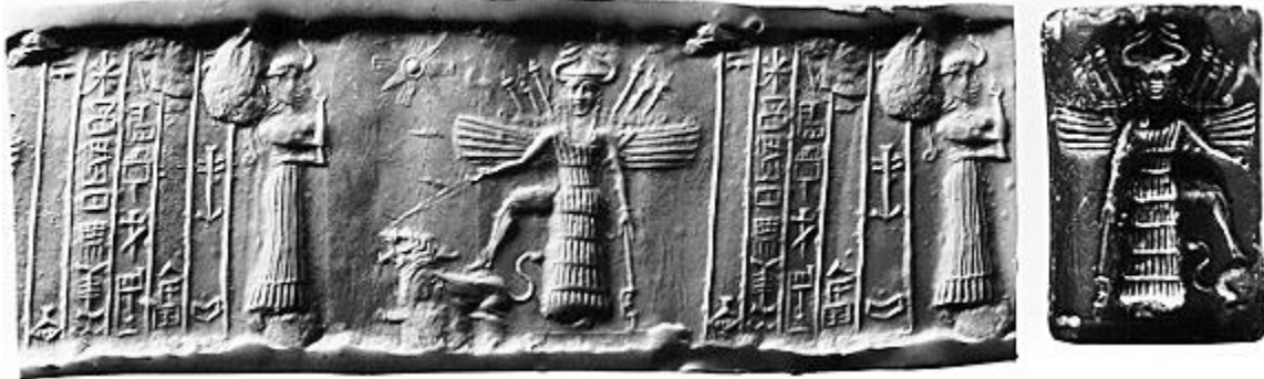
Sceau dédié à une déesse peu connue, Ninishkoun, qui intercède auprès de la déesse Ishtar en place et lieu du propriétaire. Cette dernière est armée et place son pied droit sur un lion rugissant.

pénalité prévoit la mise à mort de la fille de l'assaillant. Le transfert de punition est fréquent. Ainsi, si un maçon construit une maison et que le fils du propriétaire décède en raison d'un vice de construction, le fils du maçon est mis à mort. Cette coutume de transfert de punition est explicitement interdite dans la Bible (Deutéronome 24 - 16).