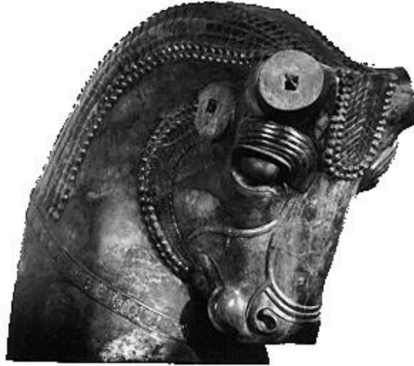
Tête de taureau géante (2,16m de hauteur et 1,58m de largeur) en grès de la période achéménide (485-424). Deux taureaux géants gardent le portique de la salle du trône aux 100 colonnes à Persépolis en Iran.