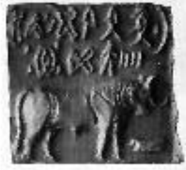
Écriture pictographique (non encore déchiffrée) sur un sceau provenant de Mohenjo-daro dans la vallée de l'Indus.

En outre, dans le recueil de lois d'Hammourabi, l'esclave est un objet de monnaie d'échange. Il peut être vendu ou échangé en tout temps comme denrée. Si l'esclave est blessé, c'est son maître qui reçoit une compensation. Toute personne aidant un esclave à s'enfuir ou lui offrant refuge, est mise à mort. Le nom du père de l'esclave ne peut être mentionné dans les registres. Par contre, dans la Bible, un maître est tenu pour responsable s'il tue son esclave (Exode 21-20). Ce dernier, mâle ou femelle, retrouve immédiatement sa liberté s'il subit une blessure corporelle de la part de son maître (Exode 21-26 à 21-27). De plus, il est ordonné de donner refuge à un esclave en fuite, et de bien le traiter (Deutéronome 23-16 à 23-17). L'esclave a son droit sacré au repos du Sabbat sanctionné dans les Dix Commandements où la Bible rappelle, comme elle le mentionne d'ailleurs dans plusieurs autres contextes, que les Enfants d'Israël furent eux-mêmes esclaves en Égypte. (Deutéronome 5-12 à 5-15).