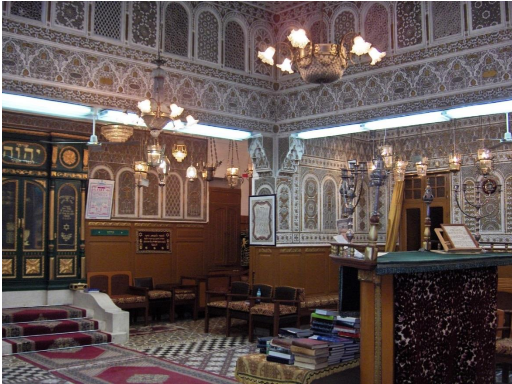
1. Synagogue Ben Sadoune - Fès 2005