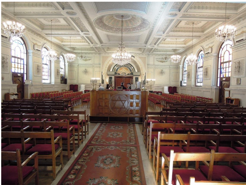
2. Synagogue Beth El Casablanca 2012