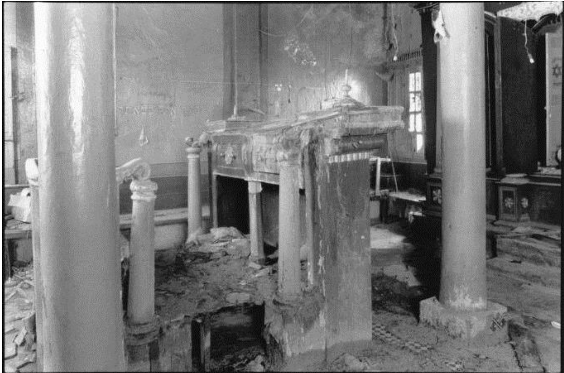
5. Synagogue Slat-el-kahal - Essaouira ca 2000