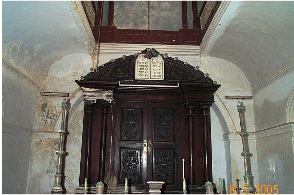
8. Synagogue Attia - Essaouira 2000