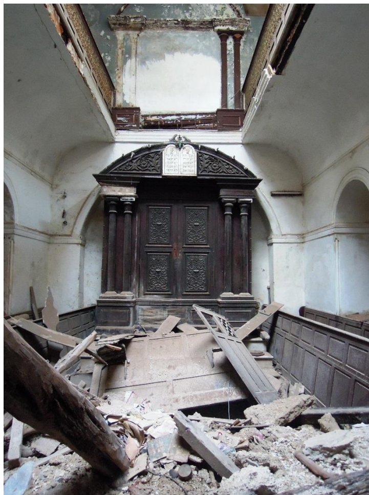
9. Synagogue Attia Essaouira 2012