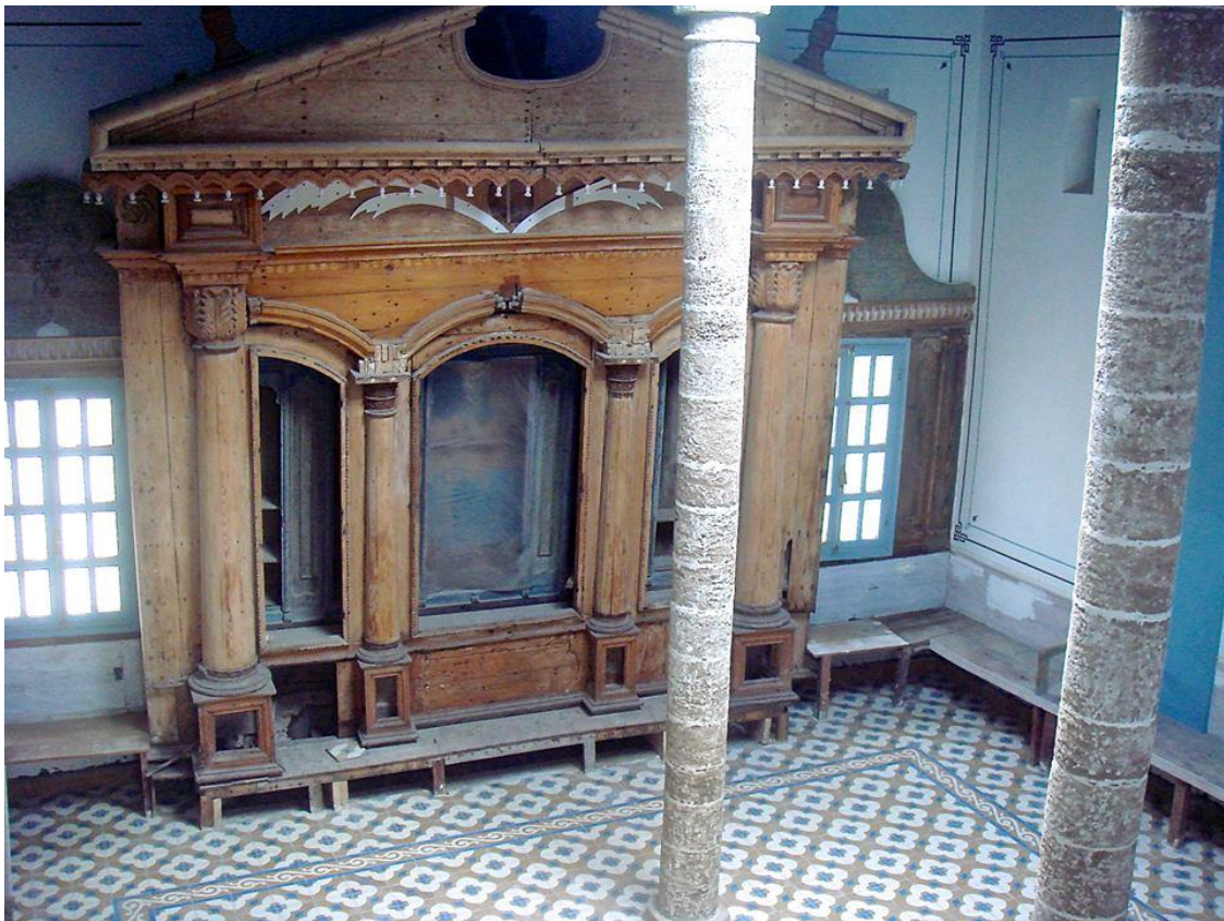
6. Synagogue Slat-el-kahal - Essaouira 2014