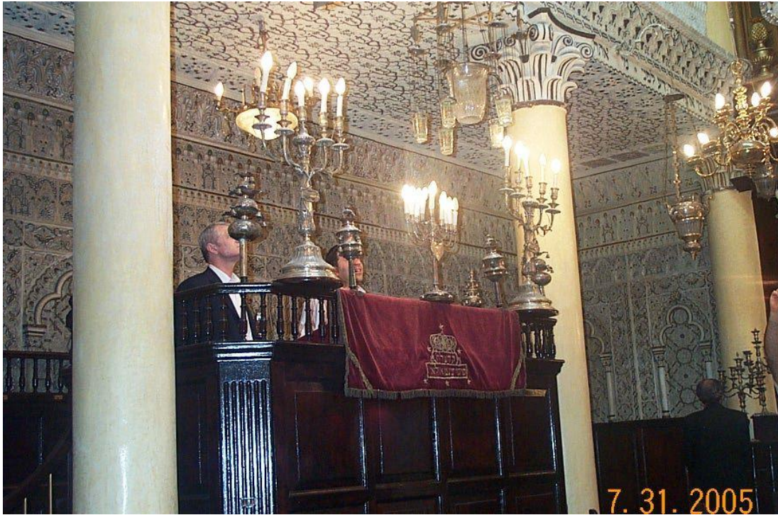
3. Synagogue Nahon - Tangerang 2005